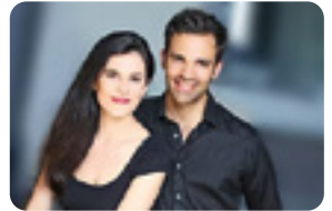
Cie Le chant de la Panthère