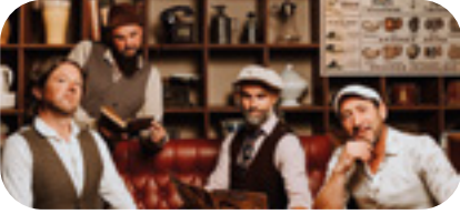
10 JUILLET Chansons françaises vintage LA CAMELOTE