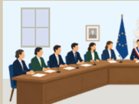
Les agents municipaux