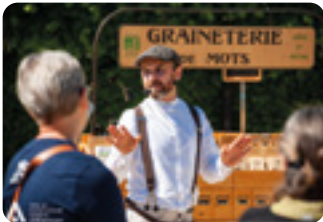
Cie Les Miscellanées

Concerts tous les samedis à 17h, du 27 juin au 29 août