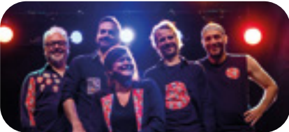
7 AOÛT Reprises des légendes des 27 27 KLUB