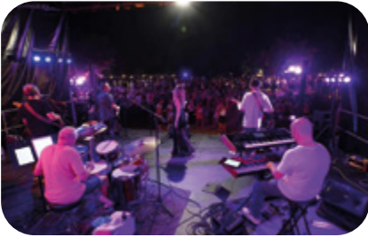
2 AOÛT Années 80 Dies'1