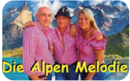
9 AOÛT Autriche Die Alpen Melodie