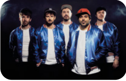
19 JUILLET Funk Dudes of Groove society