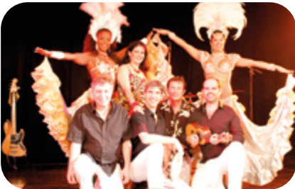
16 AOÛT Brésil Batida