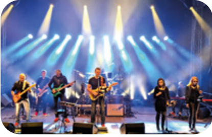
28 JUIN Tribute to Pink Floyd Think Lloyd