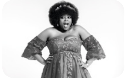
26 JUILLET Jamaïque Miss Kocoo and the Arsians