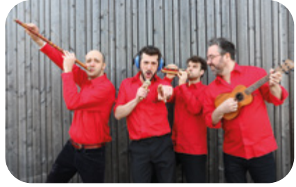
5 JUILLET Karaoké géant Météor Hits